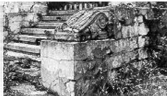
Фрагмент лестницы. Фот. 1986 г.