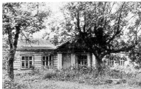
Флигель. Фот. 1986 г.

Конюшня - одноэтажное, рубленое, с тесовой обшивкой сооружение на каменном фундаменте, под высокой двускатной кровлей. Композиция фасадов - симметричная, трехчастная. По центру протяженных фасадов, над своеобразными четырехпилястровыми портиками устроена небольшая надстройка типа мезонина, с арочным проемом в торцовой стене, завершенной щипцом. Ордерный характер постройке придают пилястры с абаками в виде нащельников, соответствующие внутренним поперечным стенам. Пилястровые портики оформляют также торцовые фасады с широкими воротами. Во всех карнизах - крупные модульоны.