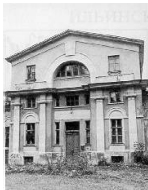
Усадебный дом. Центральная часть главного фасада. Фот. 1986 г.

Жилой флигель – одноэтажное, рубленое в лапу и обшитое тесом протяженное здание на каменном фундаменте, перекрытое вальмовой кровлей. Центры северного и западного фасадов выделены упрощенным пилястровыми портиками с треугольными фронтонами. В тимпане каждого фронта помещено большое полуциркульное окно, обрамленное рядом деревянных “рустов”. Стены прорезаны большими квадратными окнами.