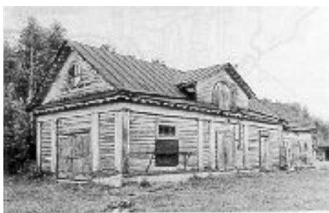
Конюшня. Фот. 1986 г.

Внутреннее пространство разделено на три помещения: в центре располагались стойла для лошадей, по сторонам - помещения для экипажей.