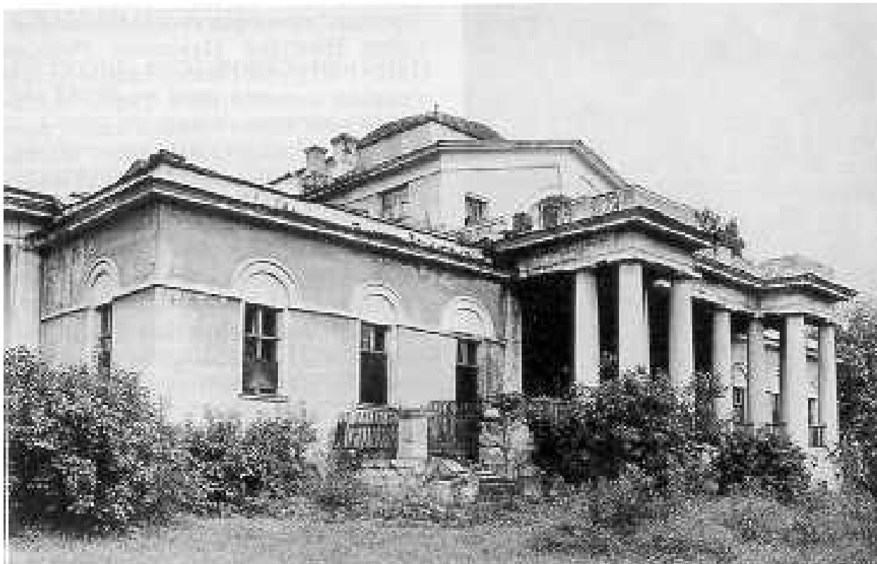
Усадебный дом. Парковый фасад Фот. 1986 г.

помещение связывает все комнаты дома. Расположенный далее центральный зал с выходом на южную террасу освещен крупными арочными окнами. В нем сохранились карнизы с модульонами и розетками, камин. По сторонам зала размещены Г-образные в плане гостиные, расчлененные парами колонн. Среди более мелких комнат выделяется восточная гостиная с эркером. Часть мебели из обстановки дома экспонируется в Кинешемском краеведческом музее.